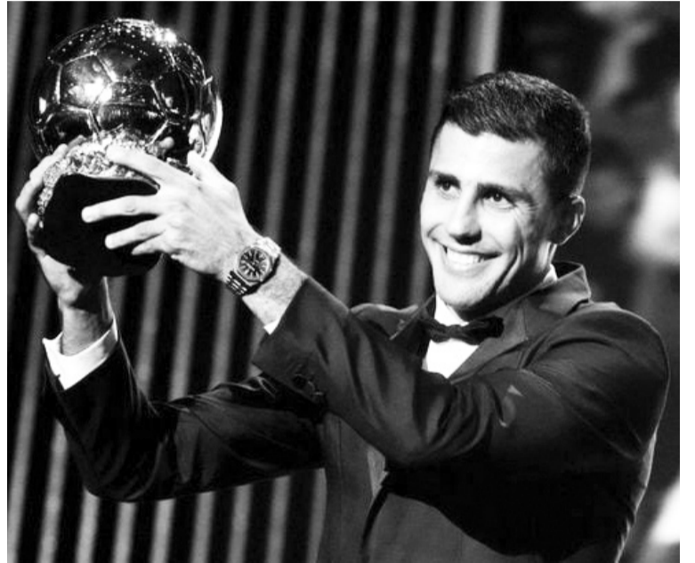
Іспанський півзахисник «Манчестер Сіті» Родрі став володарем «Золотого м'яча»-2024.

Загалом, залишивши «Жирону» (там, нагадаємо, Довбик із 24 голами виграв бомбардирську гонку приміри-2023/2024), Артем продовжив