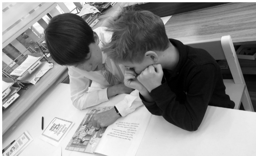
Реформують старшу школу.

Старша школа скоро зміниться, повідомляє пресслужба Міністерства освіти і науки України. Переконають, що реформа — це відповідь на запити учнів і батьків, пов'язані з поліпшенням якості освіти в старшій школі. Згідно з всеукраїнським соціологічним дослідженням, яке Київський міжнародний інститут соціології провів у партнерстві зі швейцарсько-українським проектом DECIDE на запит МОН: