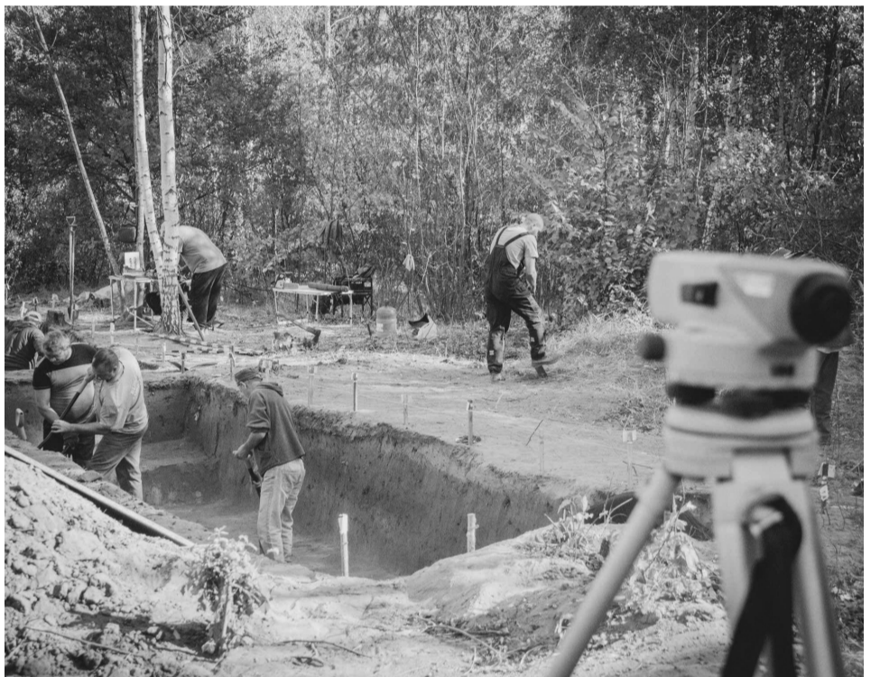
Археологічні розкопки неподалік селища Котельва Полтавської області.