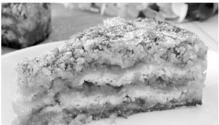
«Сухий» яблучний пиріг.