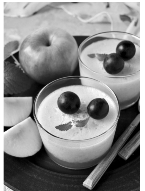
«Хмаринка» у креманці — яблучне суфле.

Цей десерт сподобається не лише панькам, які дбають про свою фігуру, адже він дуже низькокалорійний, у ньому немає цукру, а й діткам будь-якого віку, бо він справді легкий, мов хмаринка, ніжний, як дотик маминих долонь, і смачний, як ваші найулюбленіші ласощі.