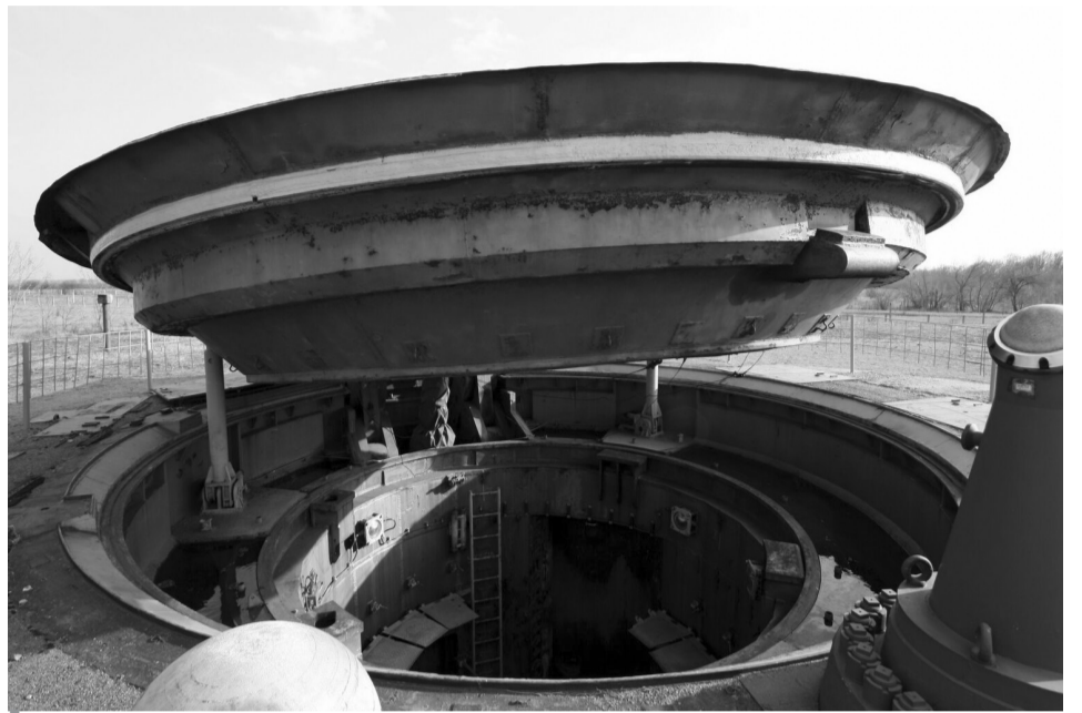
Вихід з пускової шахти МБР РТ-23УТТХ, Музей ракетних військ стратегічного призначення, смт Побузьке, Кропивницьчина.

що росія не допустить цього «за жодних обставин».