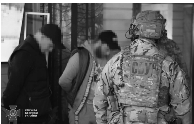
СБУ затримала лідера черкаської банди.

«Намагаючись психологічно тиснути, ватажок угруповання особисто прийшов до офісу потерпілого і погрожував йому побиттям