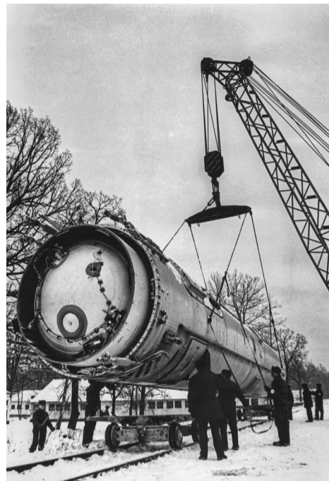
Ракети СС-18 відправляють на утилізацію, грудень 1997 року.

Чого навчає нас іще одна провокація про нібито відновлення Україною ядерного потенціалу