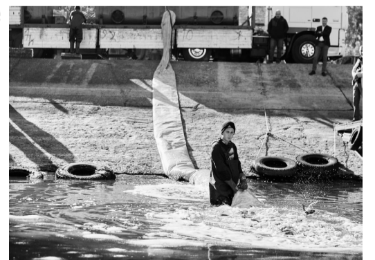
Перших мальків товстолобика запустили у Кременчуцьке водосховище.

У Кременчуцьке водосховище заселяють мальків товстолобика