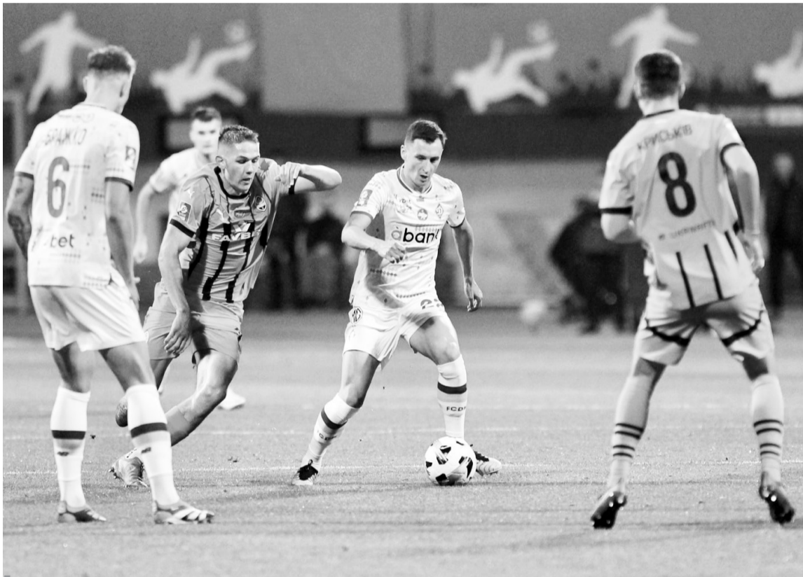
На останніх хвилинах вітчизняного «класико» динамівці врятувалися від поразки «Шахтарю».

У нинішньому сезоні головним пріоритетом для «Динамо» є національне чемпіонство