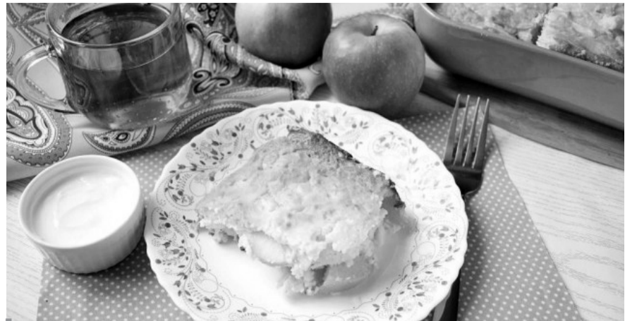
Яблучна запіканка нашвидкуруч.

Яблука миємо, чистимо від серцевинки та шкірочки і нарізаємо пластинами завтовшки 0,5 см, поливаємо лимонним соком, щоб вони не потемніли. На пательню кладемо вершкове масло і висипаємо яблука разом із лимонним соком, посипаємо цукром, корицею, мускатним горіхом, усе перемішуємо і тушкуємо на середньому вогні, наполовину прикривши кришкою, доки яблука не стануть м'якими. Тоді відставляємо пательню з вогню, відкриваємо кришку, посипаємо на-