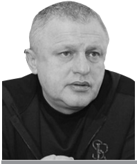
Ігор Суркіс президент ФК «Динамо» (Київ)

«Чемпіонат довгий, тож ця одна гра ще нічого б не вирішувала, навіть якби ми виграли або програли. Потрібно грати з першого і до останнього туру».