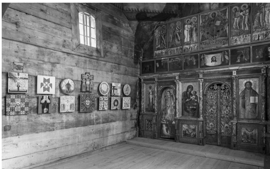
Виставка «Сим знаком переможеш».

огортає нас своїм плащем, є впізнанням українським образом перемоги, покровителькою нашого люду і війська.