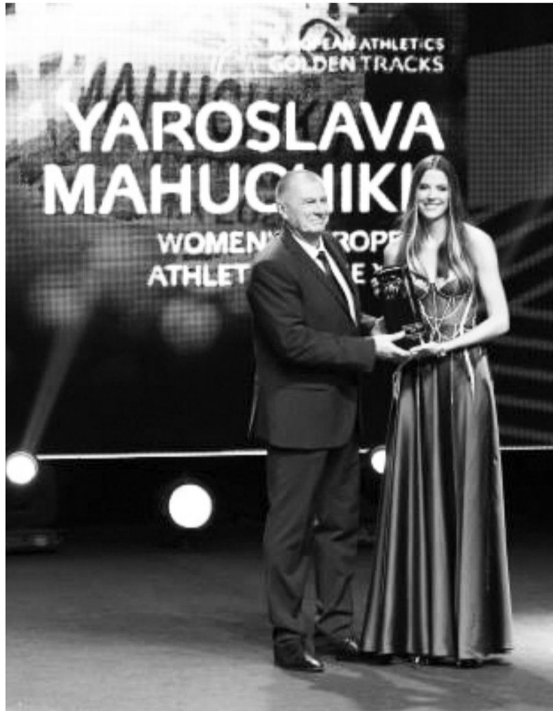
Ярослава Магучіх отримала нагороду найкращої легкоатлетки Європи 2024 року.

До слова, після оновлення світового рекорду Магучіх припустили, що в неї буде потенціал для стрибків на висоту 2,15 м. Водночас Ярослава наголосила, що планує активно працювати над тим, аби побити олімпійський рекорд. ■