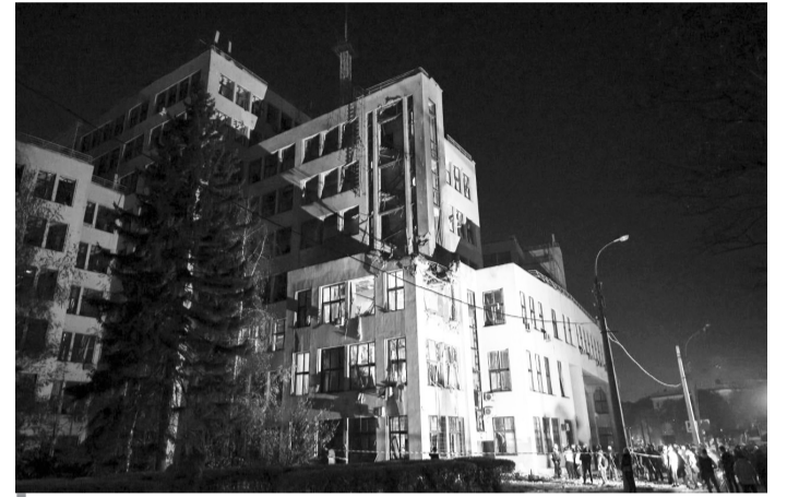
Будівля Держпрому в Харкові після російського влучання 28 жовтня.

Коментуючи чергові російські звірства, Володимир Зеленський звернувся до міжнародної спільноти із закликом посилити тиск на кремлівського диктатора, щоб змусити його припинити терор проти України. Він нагадав, що «політика умиротворення» агресорів є хиб-