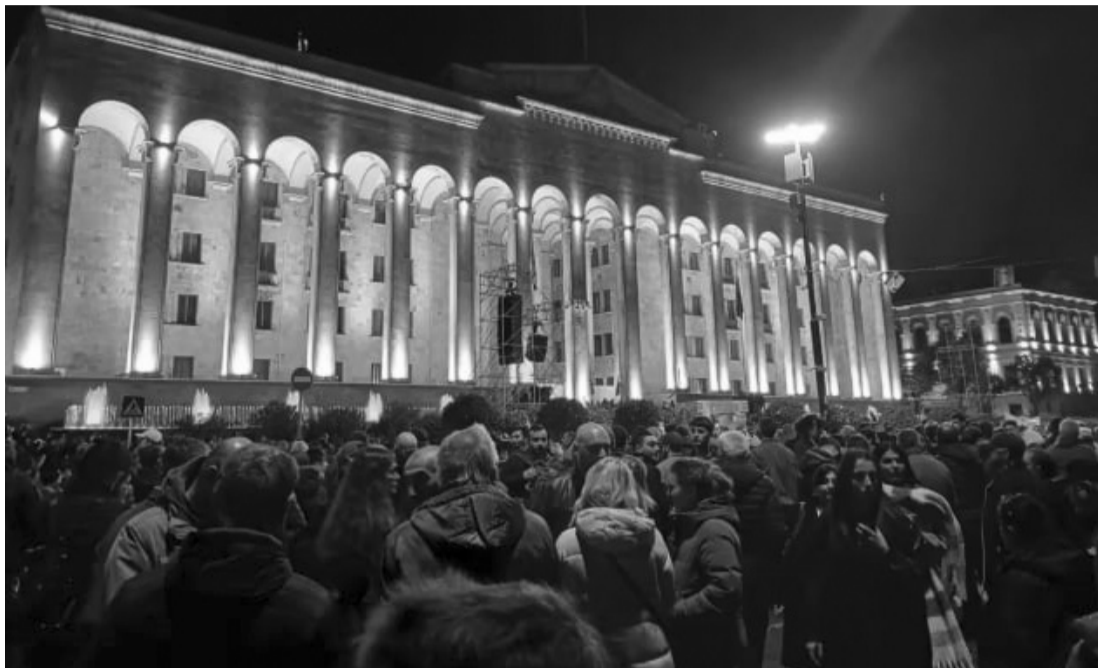
Протест у Тбілісі.

Визнання парламентських виборів у Грузії означатиме підпорядкування незалежної держави Росії