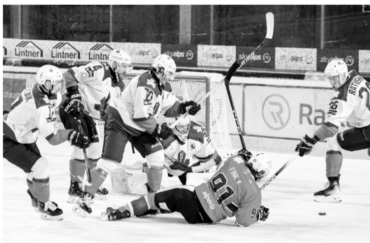
Після раннього вильоту з Континентального кубка наставник «Сокола» Олег Шафаренко поскаржився на «треш» у Федерації хокею.

Через хаос у Федерації хокею «Сокіл» провалив виступ у Континентальному кубку