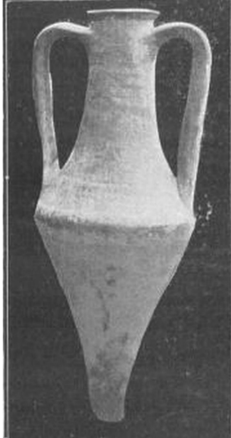
Такий вигляд могла мати амфора, уламок якої було знайдено.

Клейма (мітки) на амфорах — це найважливіше археологічне джерело для датування предмета, а також