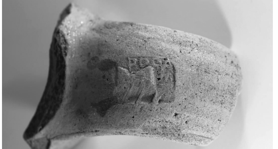
Уламок античної амфори IV століття до н. е. з рідкісним клеймом майстра.