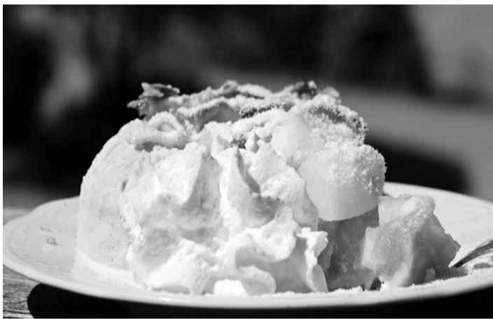
Коблер найкраще подавати з кулькою морозива.

Цей десерт готували у британських колоніях Північної Америки ще з середини XIX століття з будь-яких фруктів — вишень, персиків, груш, але найчастіше — яблук. Основу його становлять фрукти, поверх яких заливають рідке тісто або викладають корж крихкого. Походження цього слова невідоме, адже дослівно «коблер» означає швець, ста-