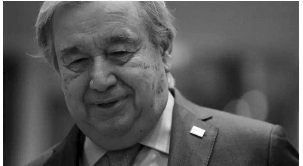
Генсек ООН Антоніу Гутерреш підставив путіну плече.

«Антоніу Гутерреш підкреслював свої зусилля щодо покращення експортних можливостей Росії, — йдеться в документі, — навіть якщо це стосува-