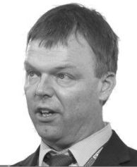
Олександр Хуг заступник голови СММ ОБСЄ в Україні

«Спостерігачі на власні очі бачили загиблих людей і поранених. Насилля, що ми бачили цього тижня, є безумством, і воно має бути зупинено!».