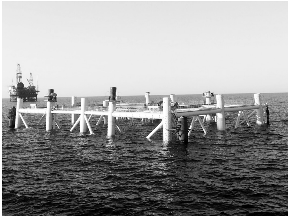
Зазнімувати роботу видобувних вишок в Аральському морі фоторепортери можуть. Поки що.

У наступному 2017 році Міжнародний консорціум, який об'єднує узбецьку національну холдингову компанію «Узбекнафтогаз», російську «ЛУКОЙЛ» і китайську CNPC, має намір приступити до додаткової розвідки, облаштування та розробки родовищ вуглеводнів в Аральському морі. До слова, угода про розподіл продукції (УРП) по Аральському блоку була підписана в 2006 році терміном на 40 років, вона включає: геологорозвідку (ліцензія на геологорозвідвальні роботи строком на п'ять років видана оператору — СП Aral Sea Operating Company) і подальшу розробку відкритих запасів вуглеводнів з терміном дії