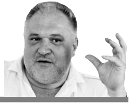
Володимир Цибулько поет та політичний діяч

«Союз Тимошенко і Наливайченка — посміховище. Це різновекторні фігури. Наливайченко настільки розчиниться в Тимошенко, що ніякого тандему не буде».