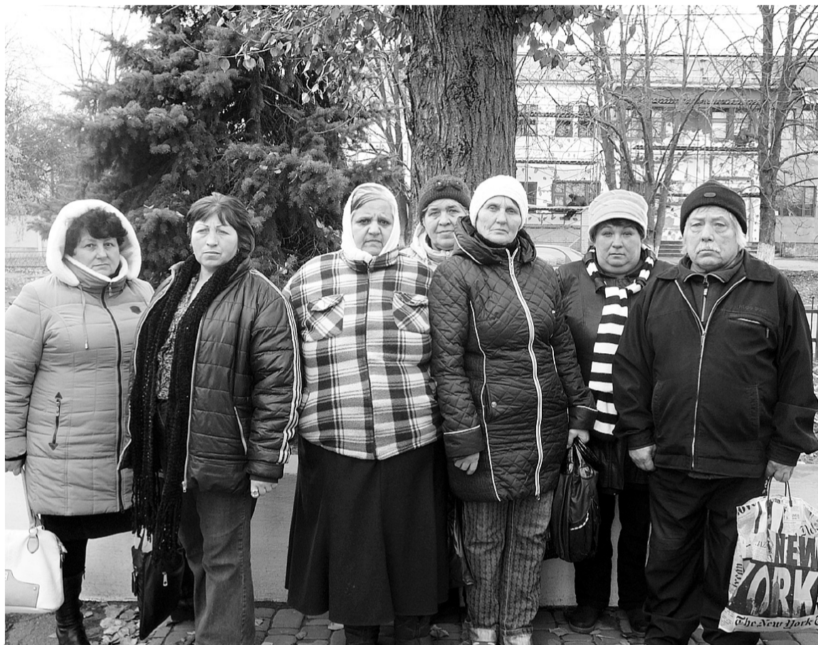
Власники земельних паїв, котрі віддали їх у довгострокову оренду, обіцяють дійти до Президента, якщо їхнього крику душі не почують на місцевому рівні.

Поставивши підписи під сумнівним контрактом, власники земельних паїв невдовзі пошкодували про це