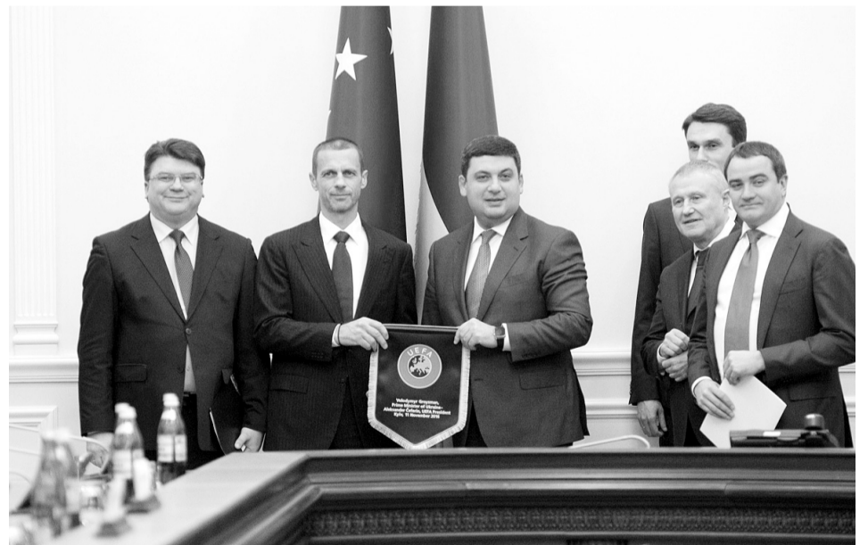
Після відвідин України новим президентом УЄФА Александером Чеферіном (другий ліворуч) у вітчизняному футболі заговорили про його важку хворобу.

Не так давно «УМ» повідомляла, що в Україні винесли судовий вердикт у першій кримінальній справі, що стосувалася зіграного «договірняка» в молодіжному чемпіонаті України (до 21 року) між «Металістом» та «Волинню». Щоправда, з огляду на пом'якшуючі обставини, безпосередні учасники того дійства, котре відбулося в 2015 році, обмежилися скромним