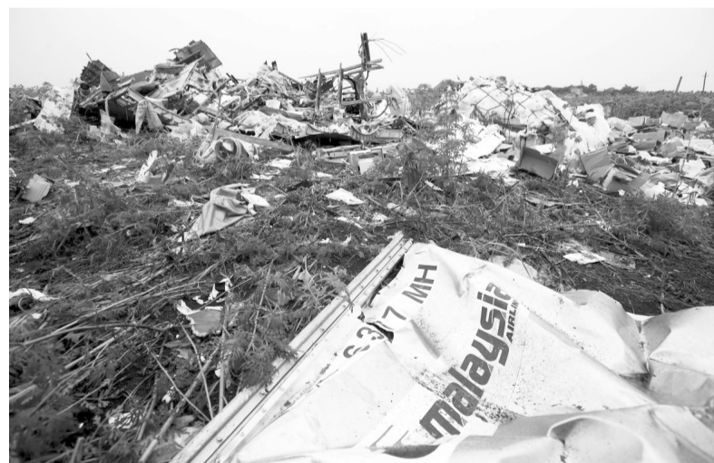
У справі про збитий «Боїнг» свідчитимуть навіть уламки.

Слідчі у справі про збитий російською ракетою на Донбасі пасажирський літак рейсу MH17 назвуть поіменно 100 осіб, винних у цій катастрофі, до 2018 року