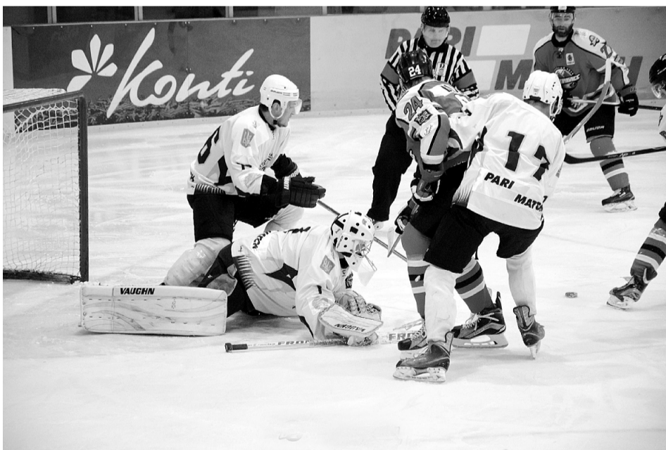
Чинні чемпіони країни чергують мінімальні поразки з розгромними перемогами.

Провівши у своїх рядах кадрову «чистку», «Дженералз» повертаються в українську хокейну лігу