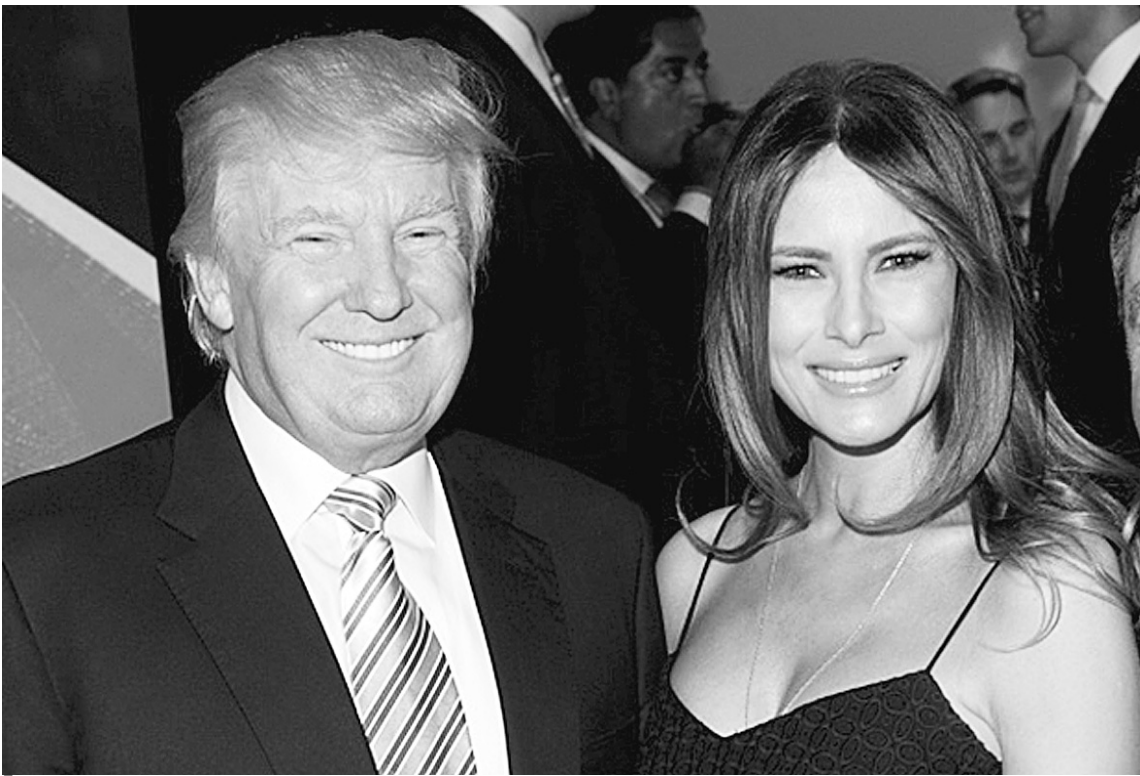
Трамп із дружиною Меланією.

Світ намагається зрозуміти, кого ж обрали американці наступним президентом