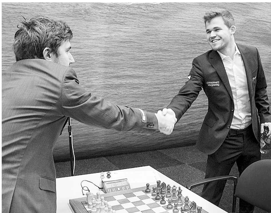
Сергій Карякін спробує відібрати у найсильнішого гросмейстера планети Магнуса Карлсена (праворуч) шахову «корону».

Попри майже рівні вікові передумови, шансів у Карякіна, котрий, до слова, в рейтингу ФІДЕ посідає дев'яту позицію, виграти омріяний титул обмаль. Магнус Карлсен, як, до речі, й королева жіночих шахів, китаянка Хоу Іфань, на кілька голів переважають усіх, без винятку, своїх опонентів. Відтак не стільки перемогою Карякіна, як поразкою Карлсена вважатимуть мегасенсаційним завершенням нью-йорського двобою. Нагадаємо, що обидві свої чемпіонські зустрічі з Анандом норвезький гросмейстер виграв достроково. Хай там як, а завчасно здаватися Карякін не планує й вірить, що може повторити досягнення Олександра Альохіна, котрий у 1927