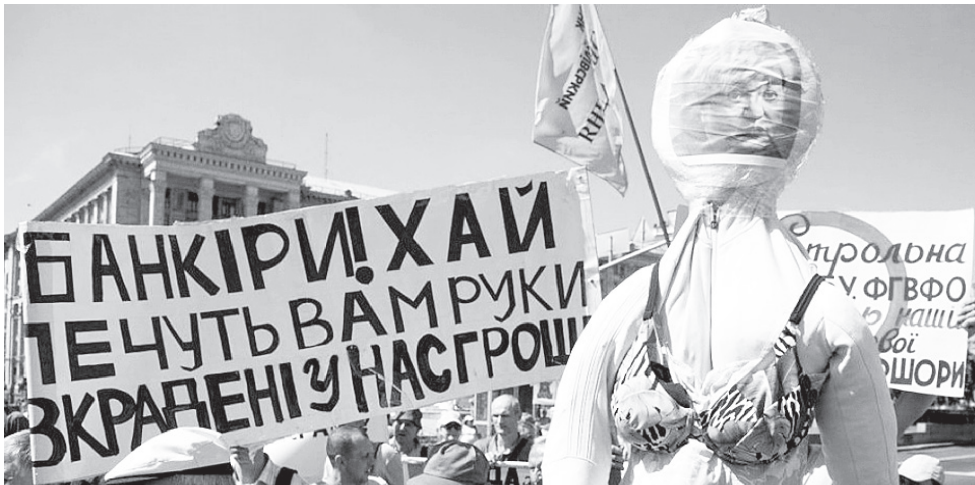
Виступи обманутих вкладників стають дедалі масовішими.

Передплатіть «Україну молоду» на 2017 рік