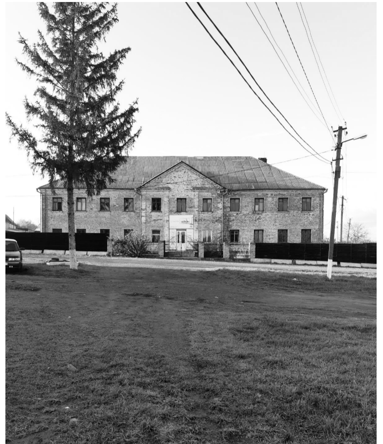
Таку нерухомість, виявляється, можна придбати всього за 24 тисячі гривень.