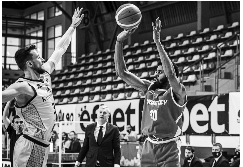
В українському дербі на євроарені «Прометей» перетиснув «Київ-Баскет».

Щойно піднявшись до еліти українського баскетболу, клуб із Кам'янського поставив перед собою вельми амбітні цілі. А перемога на євроарені лідера вітчизняної суперліги лише додасть «Прометейу» сил і наснаги. За словами голо-