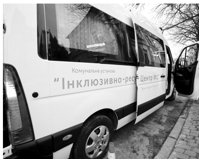
Одна з машин тернопільського «Соціального таксі».

Також, у разі необхідності, для допомоги в перевезенні залучатимуть (їх на-