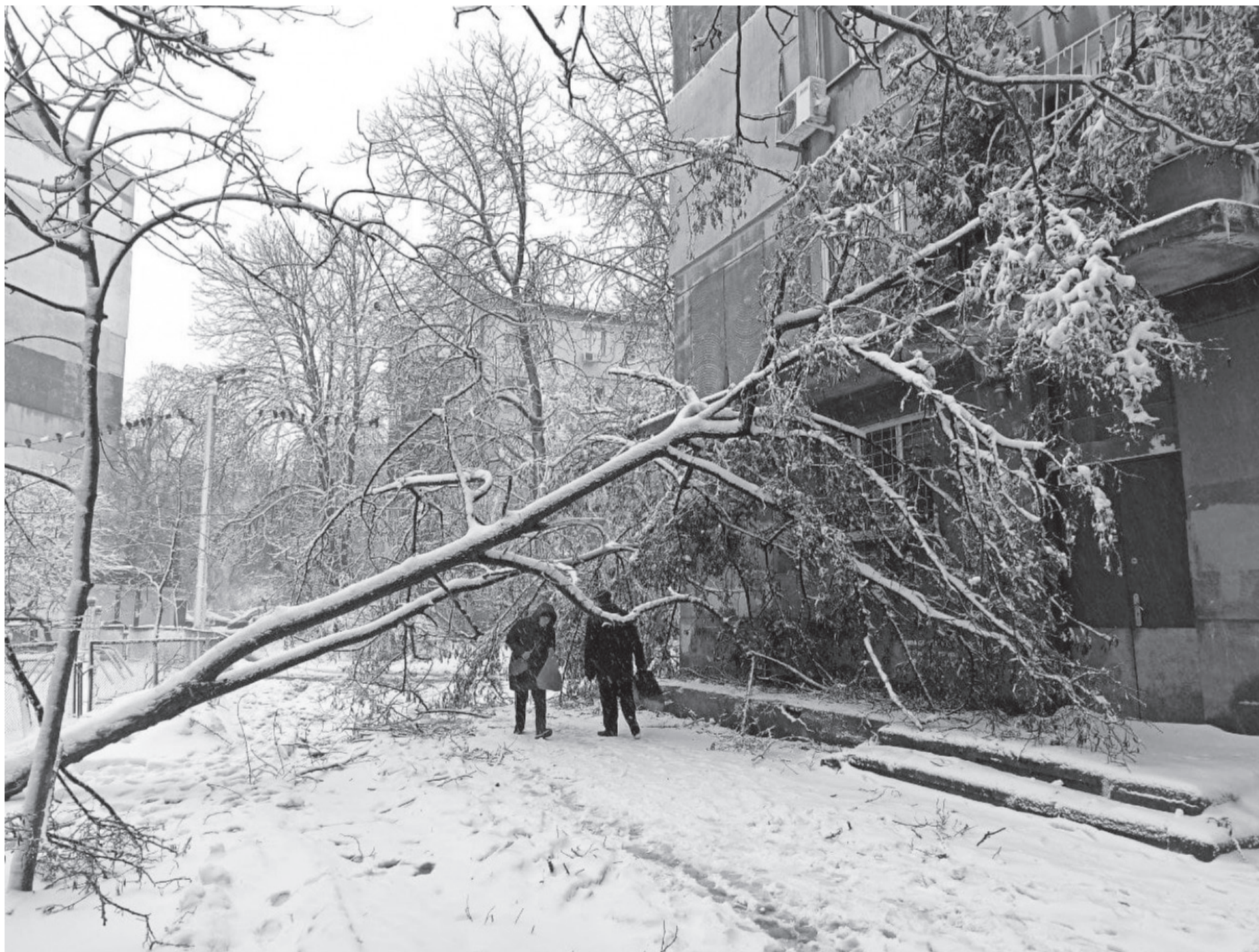
Одеса: сніг іде — дерева падають.