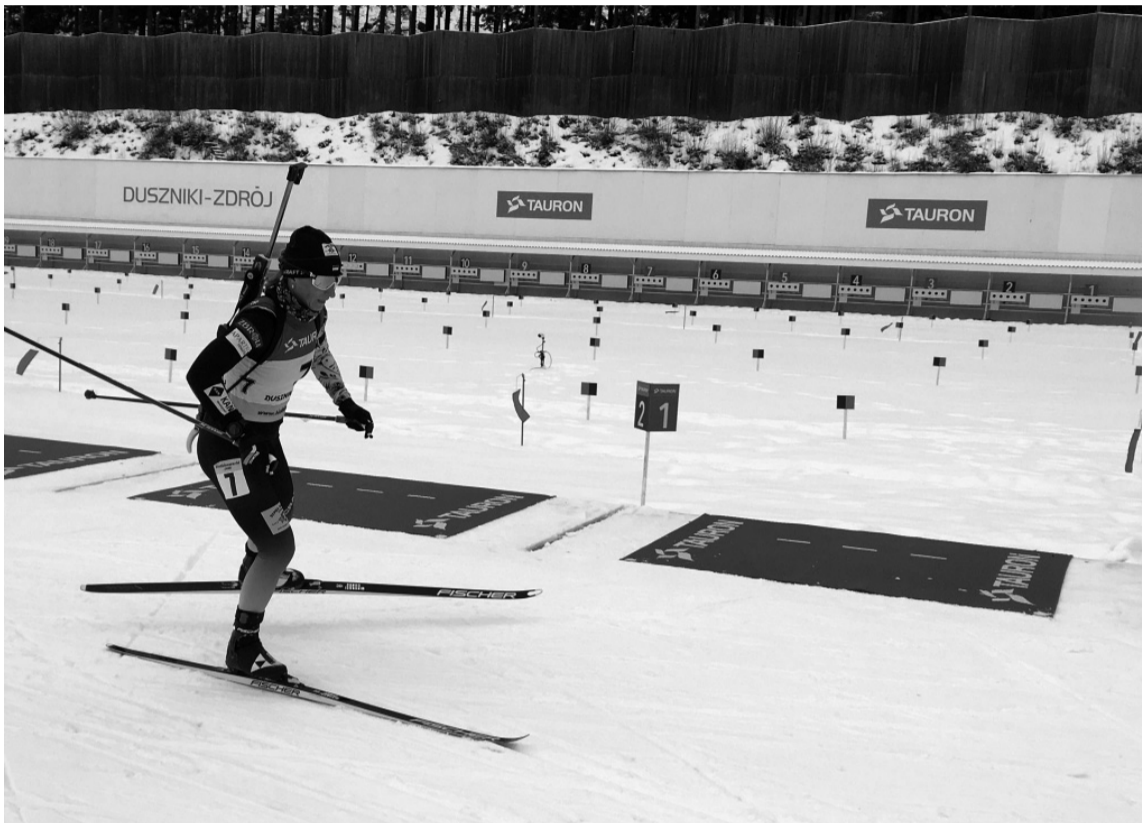
Ветеран української збірної, олімпійська чемпіонка Сочі-2014 Вікторія Семеренко має статус найтитулованішої учасниці ЧЄ-2021.

На біатлонному ЧЄ в Польщі тренерський штаб «синьо-жовтих» намагається заповнити останні вільні вакансії у збірній перед планетарним форумом