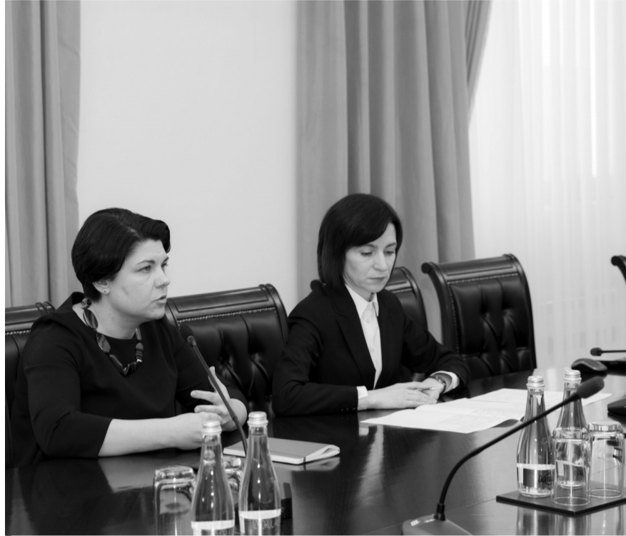
Майя Санду (праворуч) та Наталя Гаврилиця.

Президентка Майя Санду призначила главою уряду жінку. Тепер — слово за парламентом