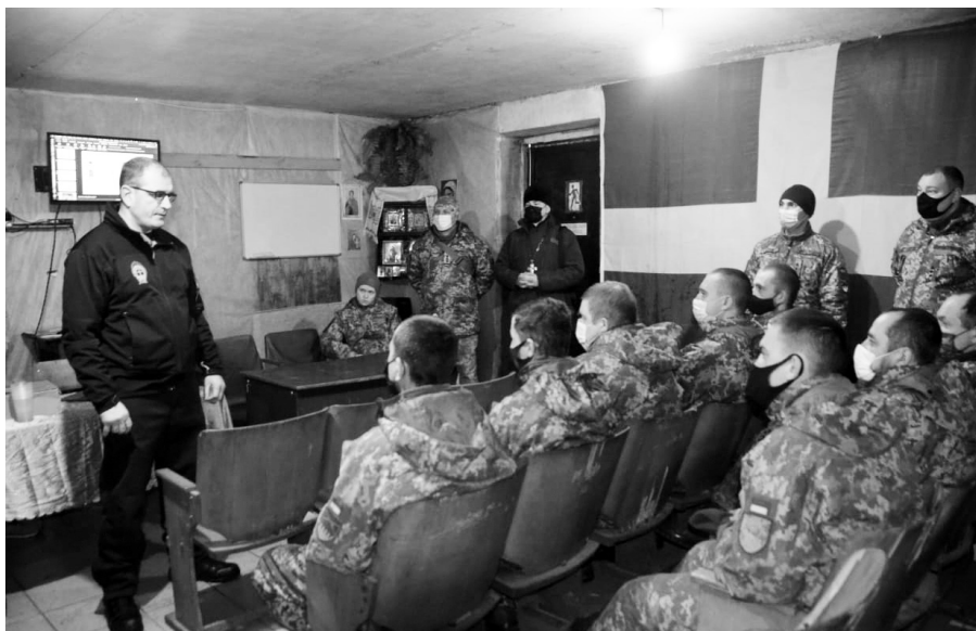
Психологічний «лікнеп».

Латвійські капелани на прикладі практичних занять показали українським бійцям на передовій, як справлятися зі стресовими ситуаціями та віднаходити душевну рівновагу в складній ситуації