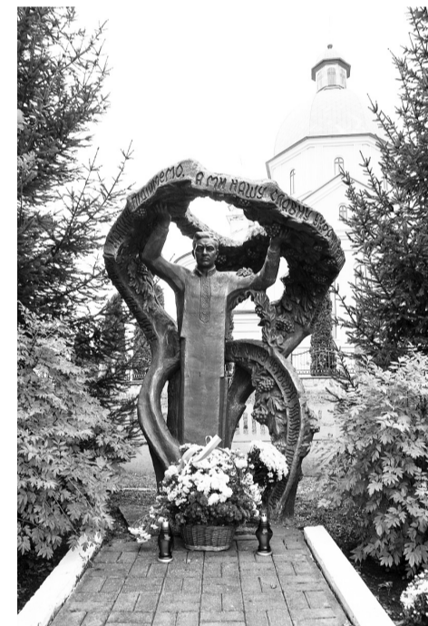
Пам'ятник Степану Чарнецькому у Шманьківцях на Тернопільщині.

У 2005 році у Львові письменниця Надія Мориквас видала книгу «Меланхолія Степана Чарнецького», в якій прослідкувала життєвий та творчий шлях поета. До 1990 року про поета не чули навіть його земляки у Шманьківцях. Уперше вчителі місцевої школи дізналися про нього від тумівців (членів Товариства української мови) з Чортківського педагогічного училища, які навесні того року приїхали, щоб посадити перші калинові кущі. Вони розповідали людям, що знали: «У вашому селі народився автор стрілецької пісні «Ой у лузі червона калина...», він син місцевого священника; він написав книж-