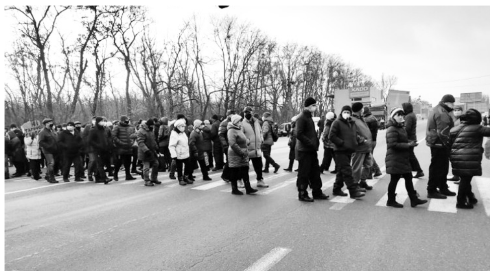
Місцева влада врахувала протестні настрої харків'ян і залишила комунальні тарифи «у спокої».

Секретар міськради заявив, що ціни на опалення та гарячу воду в Харкові не підвищуватимуть