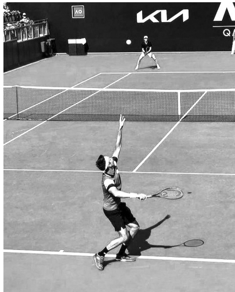
Сергій Стаховський з нетерпінням чекає свого повернення до Австралії.

Відзначимо, що, окрім Стаховського, в чоловічій сітці «основі» Відкритого чемпіонату Австралії-2021 українців більше не буде.