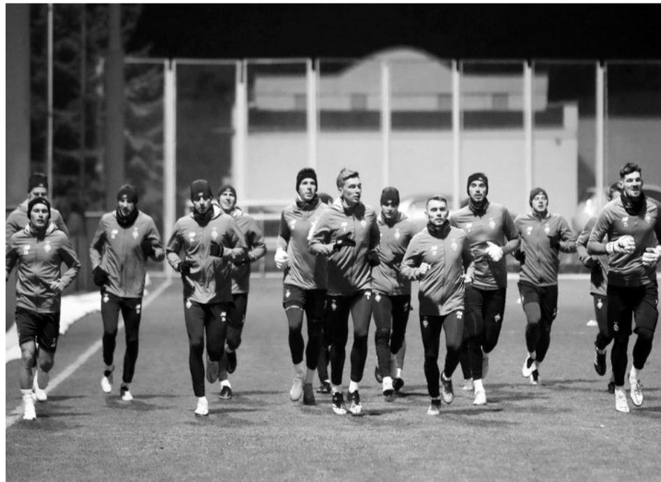
Першу частину зимових зборів київські динамівці проведуть в ОАЕ.

Що ж до «Шахтаря», то його менеджери взимку традиційно багато проводять часу, вирішуючи питання трансферного ринку. Пропозицій, котрі стосуються купівлі-продажу футболістів донецького клубу, завжди багато. Тай-