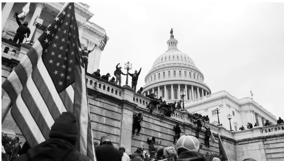
Конгрес США, нічого подібного тут іще не бачили.

У Конгресі США вдруге оголосили імпічмент Дональду Трампу