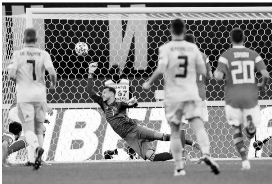
Російська футбольна збірна може втратити право на участь у фінальній стадії чемпіонату Європи-2020.

У понеділок комітет із відповідності Всесвітньої антидопінгової агенції опублікував свою доповідь із рекомендацією відсторонити Росію від участі в міжнародних змаганнях на чотири роки, дозволивши російським олімпійцям змагатися на майбутніх літніх Іграх-2020 у Токіо під нейтральним прапором, а отримувати медалі без підняття національного прапора та виконання держав-