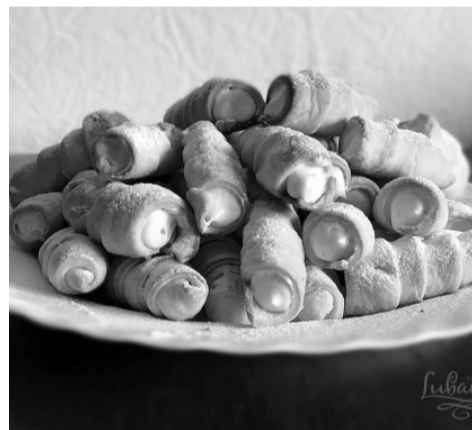
Ніжні та хрусткі трубочки просто тануть у роті.

до піків, викласти білкову суміш на тарт і випікати ще 10 хвилин.