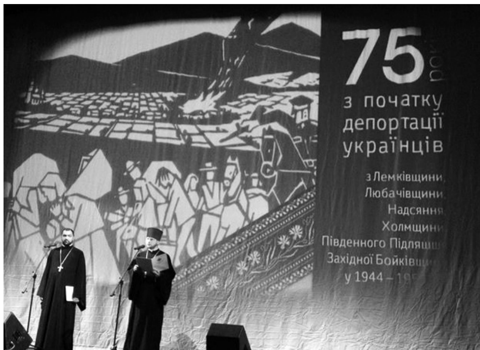
Відзначення у Києві 9 вересня 75-ліття депортації вищі «державники» не помітили.