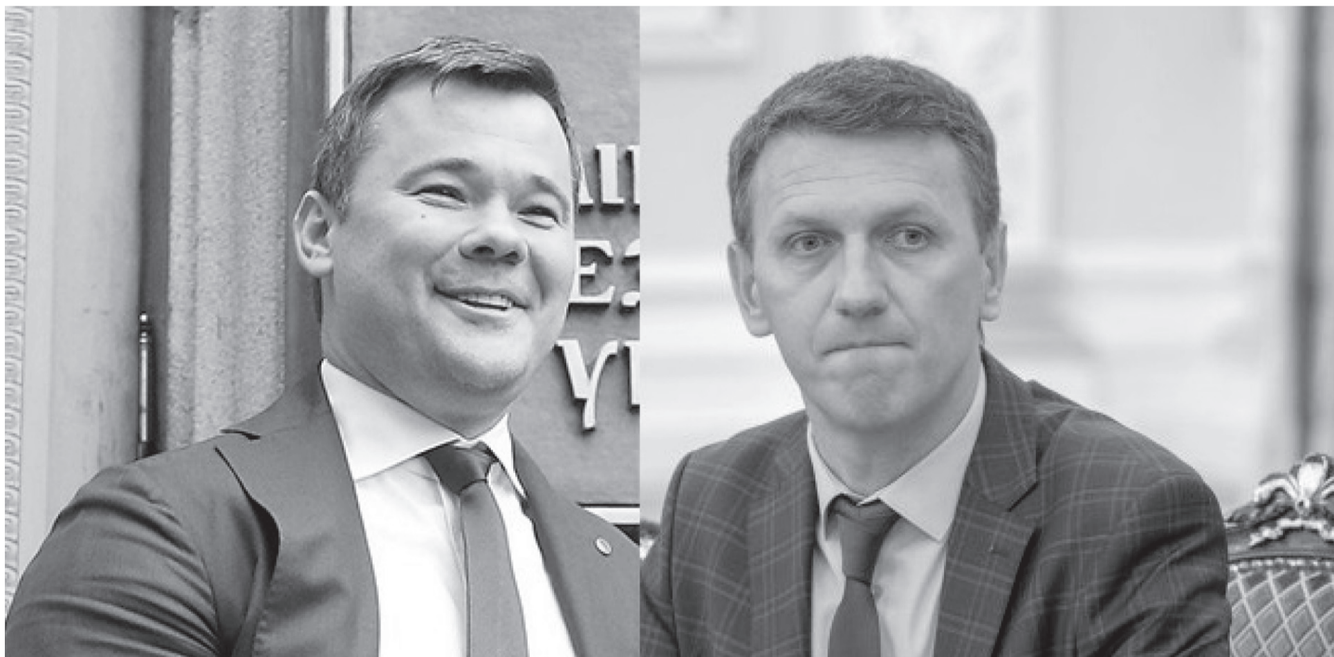
«Б.А.Й.» і Труба.