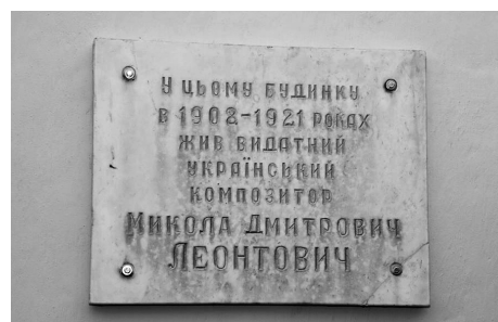
Тульчинський період Миколи Леонтовича — 12 років.

Ця активність відомих діячів трохи розметушила відповідні органи — і 9 лютого з'явився секретний рапорт начальника Гайсинської районної радянської робітничо-селянської міліції про те, що «агент уездчека Гриценко выстрелом из винтовки убил сына священника с. Марковки...» Щоправда, цей папірець радянська влада приховуватиме десятиліттями.