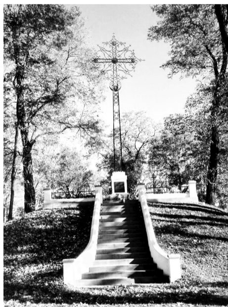
Хрест пам'яті у Пікулічах.

Про виселення українців з етнічних земель, акцію «Вісла» і концтабір у Явожному як злочинну змову комуністичних режимів Польщі та СРСР