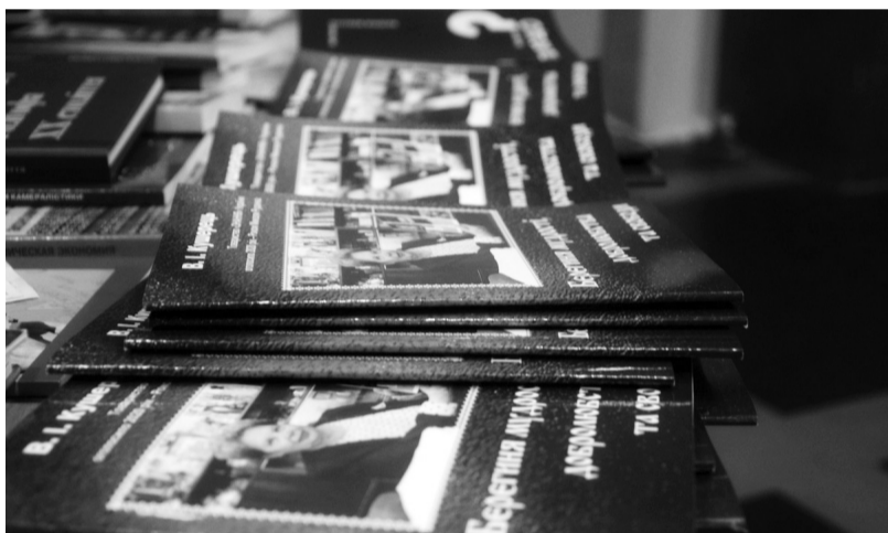
Примірники презентованої книжки «Берегиня мудрости, доброты та свободи».