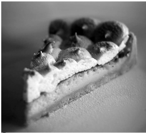
Лимонний тарт — щось новеньке.

Відкритий пиріг і крем, захований у трубочки