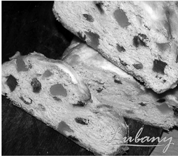
Штолен цукатів і горіхів повен.

Готуємо різдвяний смаколик, який визріває... три тижні