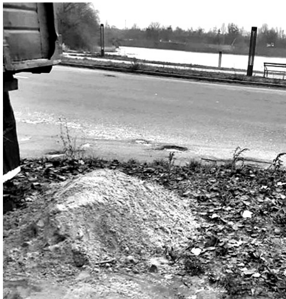
Ось як каналізаційні люки «закрили» піском.

«Ми граємося з вогнем! Не дай Бог у відкритий люк