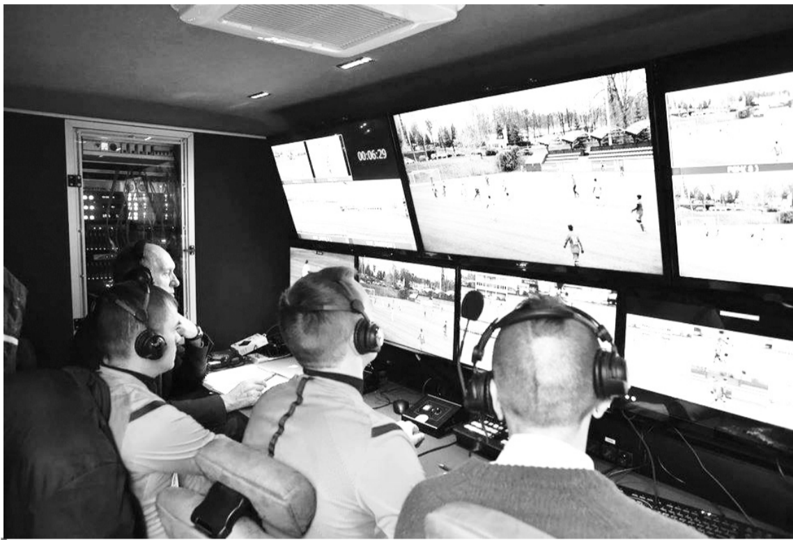
Після всебічного тестування системи VAR в Україні готуються з 2020 року розпочати її повноцінне використання.

Проте найбільше обурення у футболній сім'ї нині викликає прискіпливість системи ві-