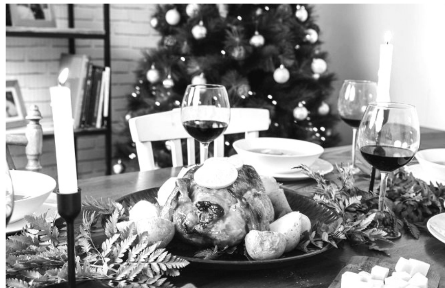
Експерти радять готувати курку — вона в ціні не зростає.

До речі, відповідно до наказу командувача Об'єднаних сил, усі контрольні пункти в'їзду-виїзду на лінії розмежування в межах проведення операції Об'єднаних сил із 1 грудня 2019 року переходять на графік зимового періоду. Контрольно-перевірочні заходи та пропуск осіб і транспортних засобів через лінію розмежування буде здійснюватися щоденно з 08.00 до 17.00. ■